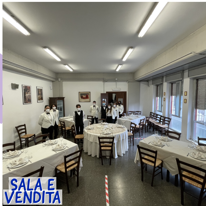
SALA E VENDITA