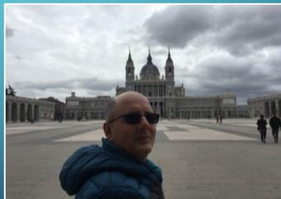
Cathedral de Almudena, Madrid

Docente su sostegno Scuola secondaria I grado Animatore Digitale Istituto comprensivo «Sauro Giovanni XXIII» di Catania