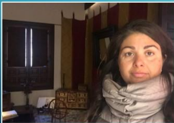
Casa natale di Miguel de Cervantes, Alcalà

Docente di Lettere Scuola secondaria I grado Animatore Digitale Convitto Nazionale «G. Falcone» di Palermo